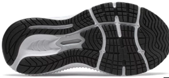
Zapato mostrado: New Balance 880v9 en Niñas